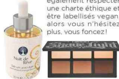
Fluide anti-âge. Nuit de Rêve, 59 €, Dermapositive . Fards. Palette Contour Visage, 45,50 €, Kat Von D , en exclusivité chez Sephora .

Vous vous distinguez par une nature rêveuse, intuitive et restez très à l'écoute de vos émotions. Textures enveloppantes, parfums délicats et belles histoires devraient séduire votre profil idéaliste et romantique, également très sensible à la galénique et au confort des matières. Et si vos produits cosmétiques peuvent également respecter une charte éthique et être labellisés vegan, alors vous n'hésitez plus, vous foncez!