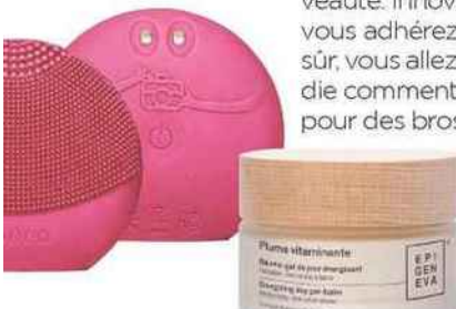
Brosse nettoyante. Luna Fofo, 89 €, Foreo . Baume. Gel de jour énergisant, 111,30 €, Epigeneva

Vous avez en commun une vraie curiosité et un goût immodéré pour la nouveauté. Innovations scientifiques, senteurs inédites, ingrédients insolites, vous adhérez à toutes les tendances et souhaitez expérimenter. A coup sûr, vous allez vous passionner pour l'épigénétique, cette science qui étudie comment l'environnement et le mode de vie influent sur la peau. Ou pour des brosses nettoyantes type Luna Fofo de Foreo, capables d'estimer le niveau d'hydratation grâce à leurs capteurs intelli-