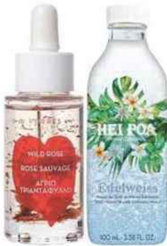
Huile visage. Rose Sauvage, 38 €, Korrès . Huile monoï. Edelweiss, 13 €, Hei Poa .